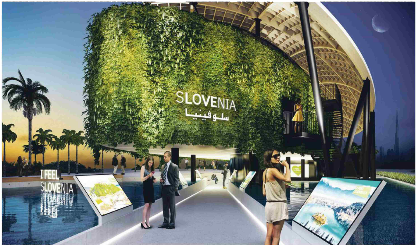
Slovenski paviljon na svetovni razstavi Expo, ki bo potekala od 1. oktobra 2021 do 31. marca 2022, stoji ob enem od vhodov na razstavišče. FOTOGRAFIJE RAČUNALNIŠKI PRIKAZ