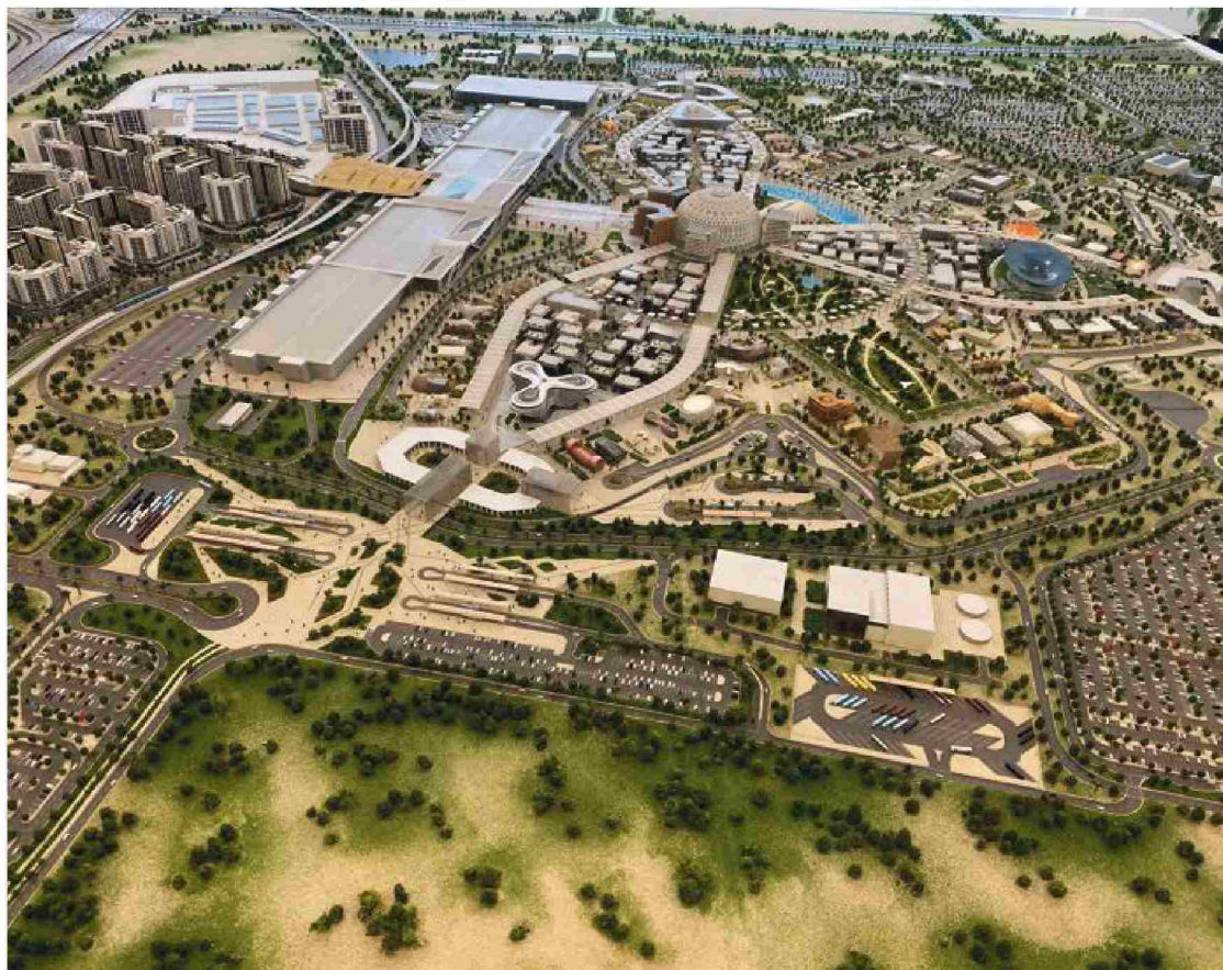
Na prijavni točki čaka obiskovalce fascinantno natančen miniaturni prikaz Expa 2020.