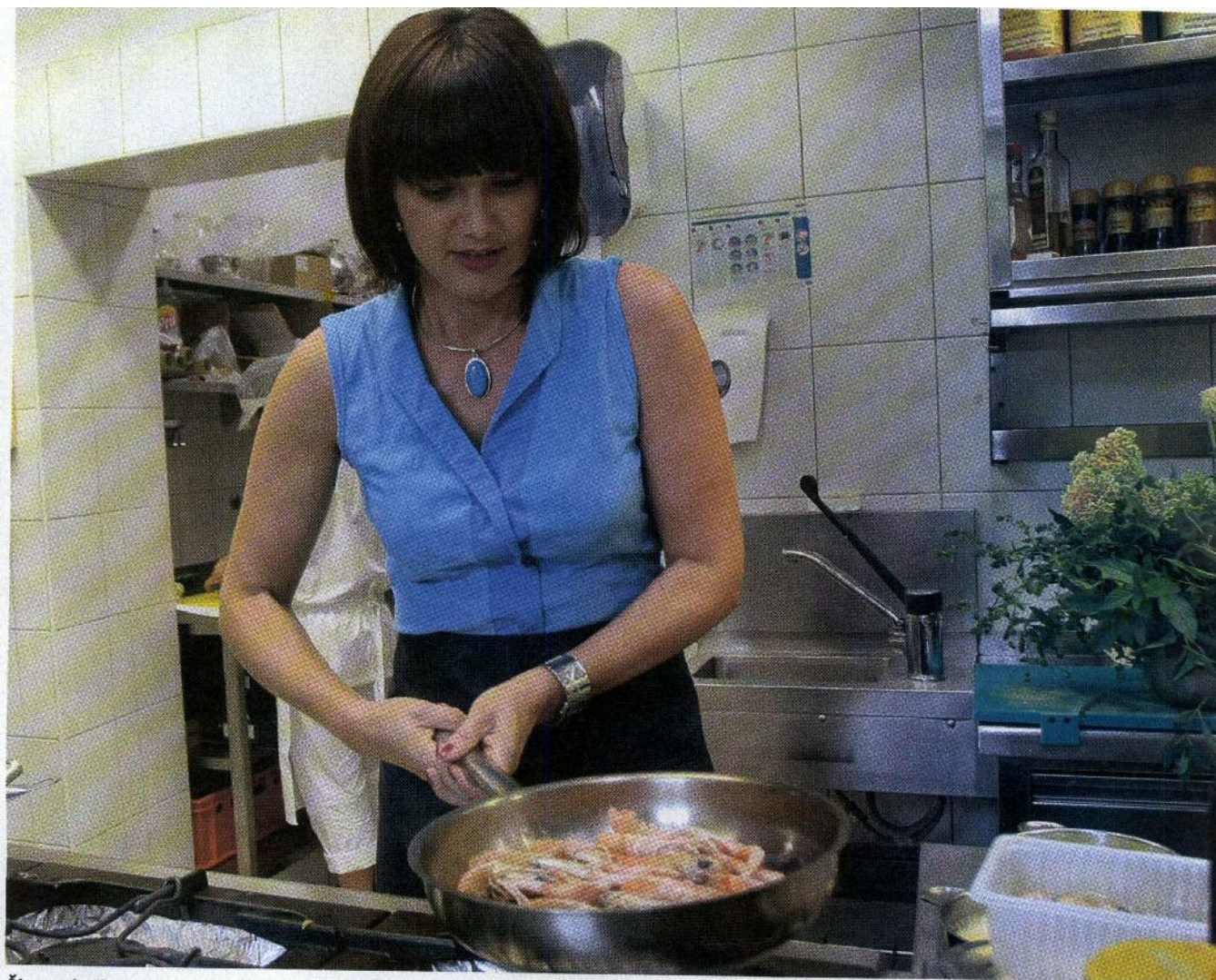
Škampi v buzari so v jedilniku preprosto zato, ker ima rada morske jedi. Najboljši so ob morju, ko ni treba paziti na oblačila.